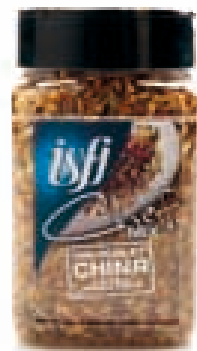
Mix Chinese kip Mix poulet Chinois 155g Chef Mix