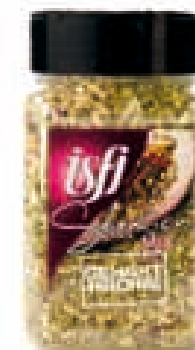
Gehaktmengeling Mélange pour hachis 140g Selection Mix

!! • Avenue de l'Industrie 20 • 1420 Braine-l'Alleud •