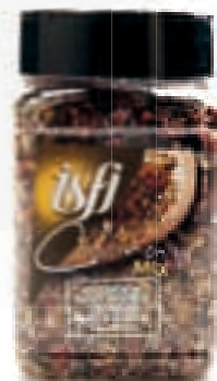
Citroen & roze bessen (vis) Citron & baies roses (poisson) 150g Culinair Mix