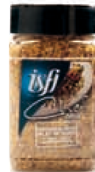
Mix voor varkenslapje Mix pour filet de porc 205g Chef Mix