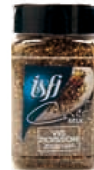
Mix voor vis Mix pour poisson 180g Chef Mix