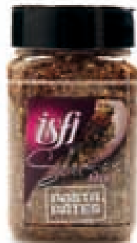
Pasta mengeling Mélange pour pâtes 140g Selection Mix