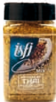
Mix Thaïse kip Mix poulet Thaïlandaise 180g Chef Mix