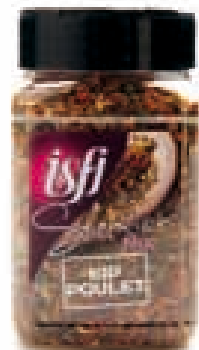
Kipmengeling Mélange pour poulet 175g Selection Mix