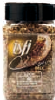
Look & bosvruchten (vlees) Ail & fruits des bois (viande) 160g Culinair Mix