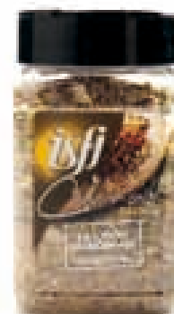
Ui & look (aardappel) Oignons & ail (pommes de terre) 200g Culinair Mix