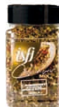
Cranberry & mosterdzaad (kip) Cranberry & graines de moutarde (poulet) 155g Culinair Mix