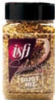
Rijst mengeling Mélange pour riz 120g Selection Mix