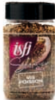
Vismengeling Mélange pour poisson 200g Selection Mix