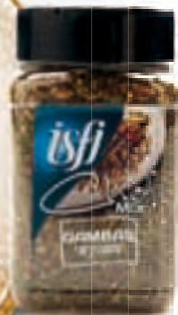
Gambamix Mix pour Gambas 125g Chef Mix

Développé par Christer Elfving afin de permettre à tout type de chef de réaliser une vraie explosion de goûts.