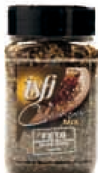
Fetakaas & zwarte olijven (salade) Fromage feta & olives noir (salade) 140g Culinair Mix