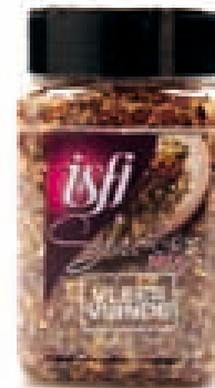
Vleesmengeling Mélange pour viande 175g Selection Mix